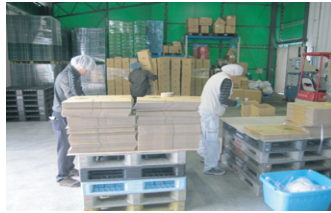
段ボール箱組み立て