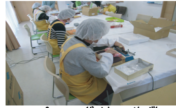
スプーン袋詰め作業